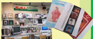
店内でコーナー作りを展開

成人式、旅行などで、個性を活かしたアルバム作りをおすすめし、「フロンティア」の稼働率アップと単価アップを狙います。