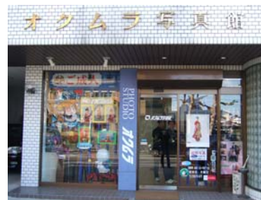
今回の取材で協力先